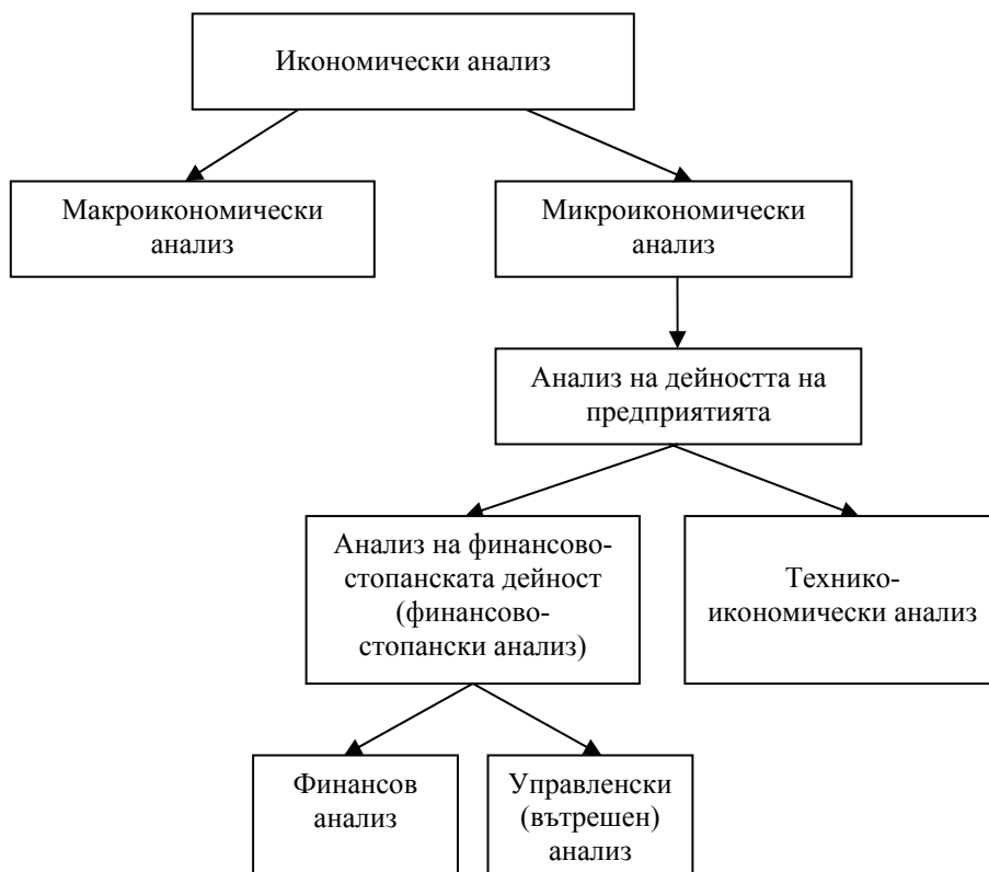
Схема 1.1. Икономически анализ

Финансово-стопанският анализ се разглежда в три взаимно свързани помежду си аспекта. Финансово-стопанският анализ е наука, заемаща самостоятелно място в научното пространство. Като наука той обективно притежава свои предмет, обекти, съдържание, метод, методика, методология, цели, задачи, функции, организация и принципи. Финансово-стопанският анализ е специфична функция на управление в системата за управление на предприятията. Той е практическо проявление на управленската функция анализирани. Финансово-стопанският анализ като практико-приложна дейност е подсистема в системата на финансовия мениджмънт на предприятието.